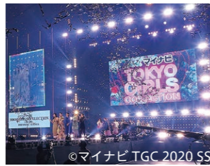
TGCによるショーのイメージ