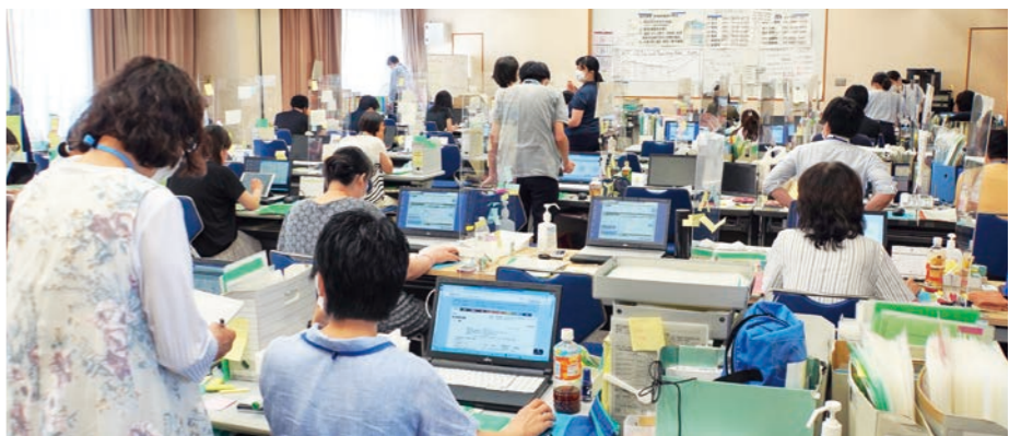
直近のピーク時には陽性者の健康観察などに最大100人の職員を投入するなど、体制を強化

貸して連絡手段を確保するなど、「自宅で療養する方が孤立することのないよう支援しています。」