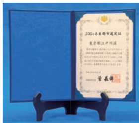
SDGsの達成に向けて優れた取り組みを行う自治体として「SDGs未来都市」に選定

さて、今年には山形県鶴岡市との友好都市盟約締結から40周年を迎えます。先日、その記念式典がオンラインで開催されま