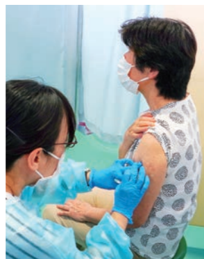
区内では5月からワクチンの接種が始まりました

予約が取りづらいという声も頂いており、ご不便をお掛けしておりますが、7月未だに65歳以上の希望者へのワクチン接種が完了するよう、すでに予定量のワクチンの確保と接種体制の整備はできています。また一部医療機関においては個別接種の予約枠を拡大していただくとともに、区が行う集団接種についてもタワーホール船堀での予約枠を約1万1000人分拡大し、6月14日から7月11日まで