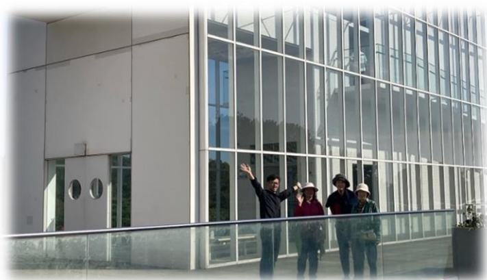
FHウォーキング部員とともに 葛西臨海公園にて撮影