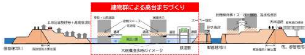
図 建物群による高台まちづくりのイメージ

また、浸水後安全を確保した上で、段階的に避難のできる非浸水動線（浸水しない避難経路）を、建築物と歩行者デッキ等でつないだ建物群を形成していく。