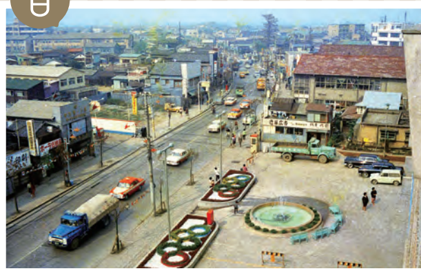
撮影年 上：昭和39（1964）年 下：昭和59（1984）年