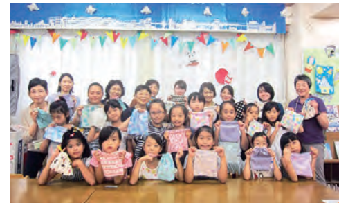
完成した作品を手にして記念撮影

「子どもたちにとって充実した時間になっているんですね。」 講座を楽しみにしてくれて、毎回参加してくれる子どももいます。ものづくりは子どもたちが大好きな活動の一つです。「これから学んで一つの物を完成させる」。この充実感、達成感は子どもたちの成長に大切なものだと思います。 一方で、この講座を通して私たちが教える側も多くのことを学ばせてもらっています。講座終了後には反省会を開いて、教材や教え方を振り返り、今後のより良い活動に向けて話