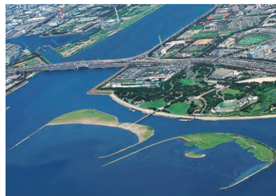
人工的に造られた西なぎさ（左）と東なぎさ（右）

海浜公園を計画していた当時、 人工なぎさ（海浜）を造った事例 は、沖縄国際海洋博覧会会場のエ メラルドビーチ（昭和50（1975） 年完成）など、世界にいくつがあ りました。しかし、それらはレク リエーションの利用を主目的とし ており、葛西海浜公園のように三