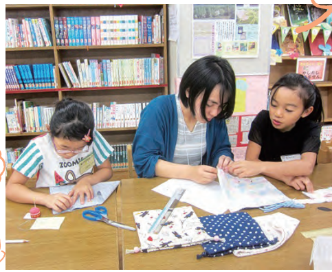
児童に優しく教える愛国学園短期大学の学生

などの学生たちです。児童1、2人に対して指導者1人が付き、子どもたちのペースに合わせて教えます。 縫い物講座では巾着袋やペットボトルカバーなどを、編み物講座では小物入れなどを作ります。縫い物と比べると編み物は初めて挑戦する子どもが多いのですが、約2時間の講座の中でもだんだんと慣れて、一つの作品を完成させています。最後に作品を持って全員で写真を撮るのですが、その時間までに仕上げようとみんな一生懸命に作っています。作品が完成すると「楽しかった!」「できた!」と跳びはねて喜ぶ子どももいますよ。