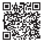
▲専用ホームページ