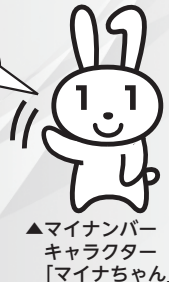
▲マイナンバー キャラクター 「マイナちゃん」

現在、マイナンバーカードの発行には通常よりも時間がかかります。早めの申請をお勧めします。