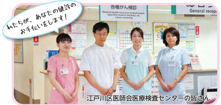
江戸川区医師会医療検査センターの皆さん