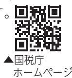
▲国税庁ホームページ