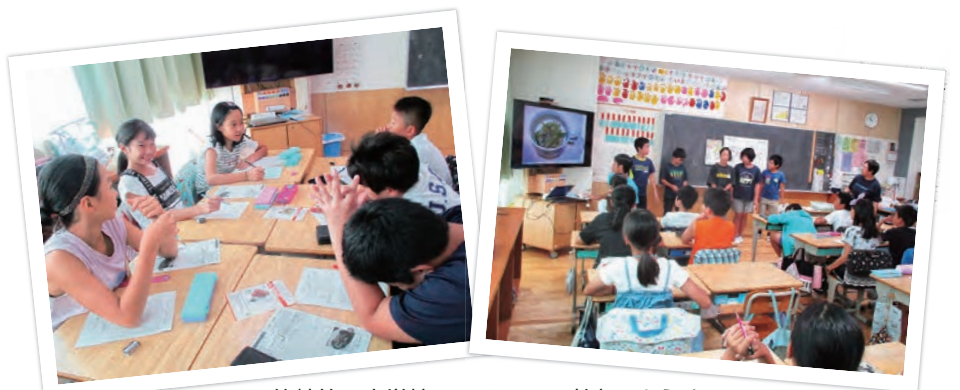
篠崎第三小学校でのメニュー考案のようす

毎年、大人からお子さんまでたくさんの方から応募があります。中でも区立小学校では、クラスや委員会、クラブなどで食事バランスについて話し合ったり、学習したりして応募されています。