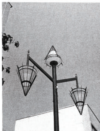
▲おしゃれな装飾灯