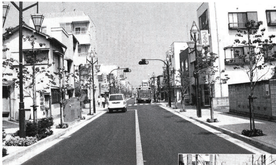
◆はなみずきロードー之江

やさしさと美しさのある道へ。今井街道と一之江通りが、ふれあい道路として生まれ変わりました。