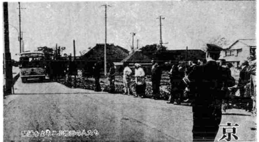
開通をよびこみ地元の人たち