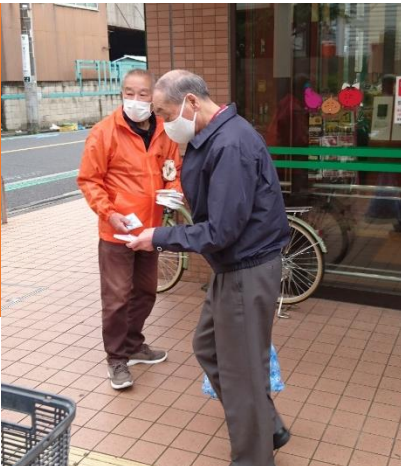
↑スーパーでの街頭啓発活動