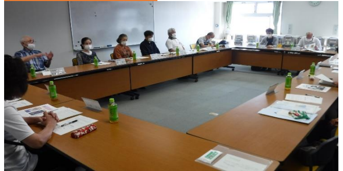
↓第2回小岩地区部会の様子