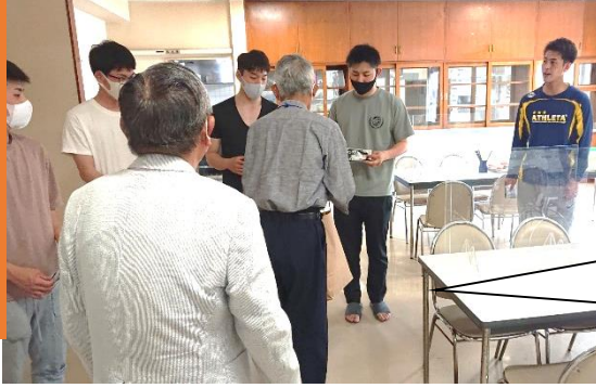
↑葛西警察署の職員寮での啓発活動の様子