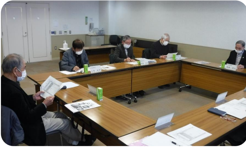
第一回広報部会の様子