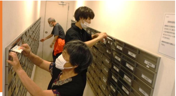
← 大型マンションでの ポステイング活動