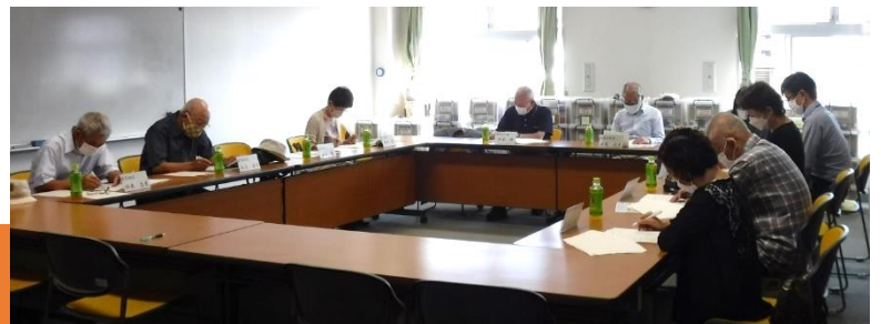
↑第2回鹿骨地区部会の様子