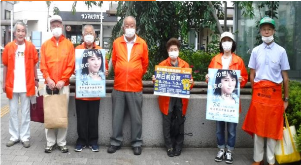
瑞江駅での ↓街頭啓発活動