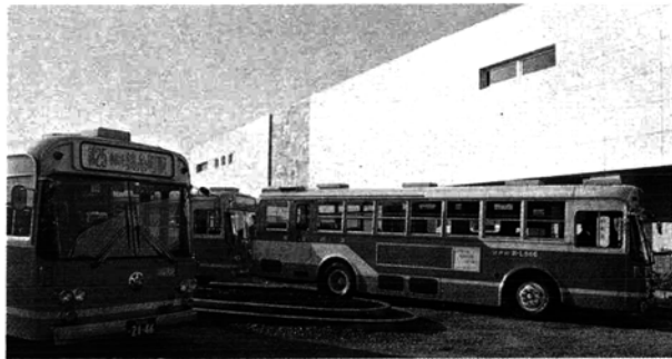
▲船堀駅(689) 6121 〒134 江戸川区船堀3-6-1