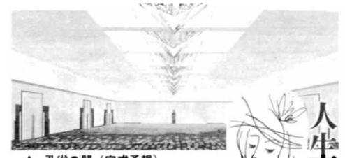
▲孔雀の間(完成予想)

人生の門出、趣味……希望の施設を センスあふれる名前で呼んでください 結婚式場(ひろろ室)や各種集会室などでおなじみの区民センターが、一段と豪華に一段と親しまれる施設に変わります。5階部分の改修工事が急ピッチに進められ、9月3日には、20名が一室に集えるひろろ室(孔雀の間(10名で2室)、62名の雅の間が誕生します。いずれも目をみはるような施設として人気を集めることでしょう。