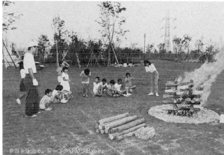
テラスも上々。オープンを待つばかり。