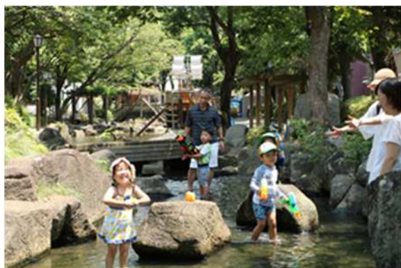
小松川境川親水公園

420 kmに及ぶ水路があり、農業用水や水上交通の役割を担っていました。しかし、急速な都市化により、これらの河川は生活排水の流れるドブ川と化し、環境悪化の一途をたどっていました。やがて、下水道整備が進み、治水や水利機能を終えるなか、水路を埋め立てる計画もありましたが、「昔から親しんできた川が消えるのは耐えられない」との区民の強い思いを受け、昭和 47 年に「江戸川区内河川整備計画（親水計画）」を策定し、この親水公園第 1 号として、昭和 48 年に日本で初の親水公園である「古川親水公園」が整備され、現在では 5 路線の親水公園と 18 路線の親水緑道が整備され、総延長約 27 kmに及び「水と緑のネットワーク」が形成されている。