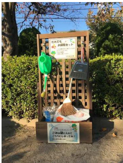
『誰でもお掃除セット』設置状況