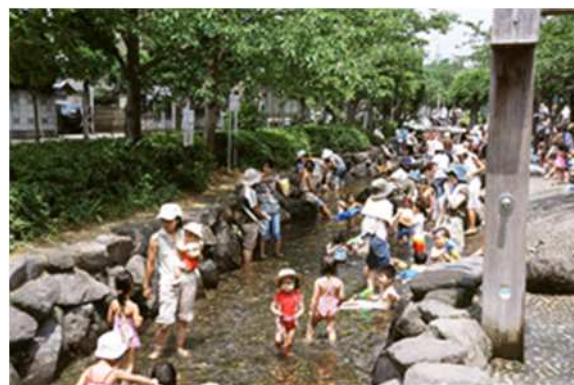
一之江境川親水公園