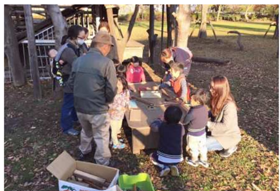
活動場所：小松川ゆきやなぎ公園 団体名称：ゆきやなぎプレパーク小松川の会 活動内容：冒険あそび場の運営