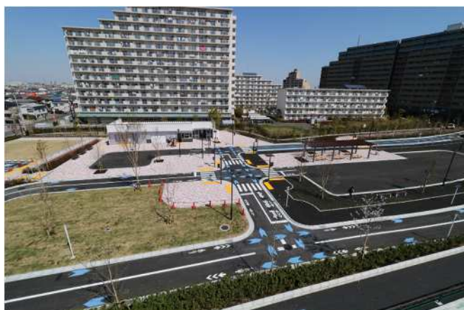
東部交通公園（平成31年4月完成）

公園の高台化は、水害時の一時避難所や、物資輸送などの中継拠点として機能を担うために重要です。東京都施行のスーパー堤防の上に高台の交通公園を整備しました。