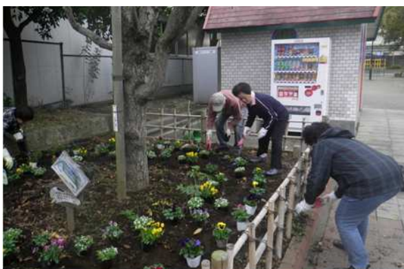
活動場所：逆井公園 団体名称：平井一丁目友和会 活動内容：花の手入れ