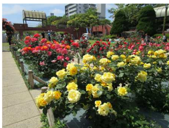
フラワーガーデン（総合レクリエーション公園）