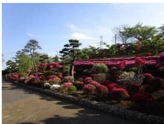
なぎさ公園（総合レクリエーション公園）

区民全体や地域の様々な活動拠点となるような公園については、特徴のある整備を進めています。