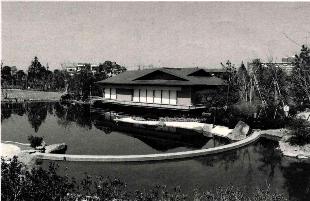
つつじ山から見た潮入りの池、主池、源心庵など ※江戸川平成庭園は、いつでも入園できます(無料)。なお、源心庵の利用は有料です。