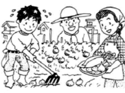
※No.21、22、23、24の4農園は新設のため、区画数を多少変更する場合があります。※1区画は約15㎡

「ぼくの植えたトマトこんなに大きくなったぞ」「わたしのナスもよ」……収穫期の区民農園では、家族のこんな楽しい会話や喜びの声がよく聞かれます。そして、ここはさらに近隣の耕作者同士、家族同士のふれあいの場にもなっています。 土に親しむ機会が少ない都会地で自分の手で畑を耕し、種をまき、収穫の喜びを味わえる区民農園——今回は、新設の4農園を含め、24か所(1千335区画)で利用者を募集します。ご希望の方は、なるべくお近くのところを選び、ご応募ください。 「希望の方は、なるべくお近くのところを選び、ご応募ください。」 利用者の決定 資格審査のうえ、定員を超えたときは抽選で決定します。 当選発表 3月22日ごろ、区役所経済課・区民課、各事務所および応募された農園に掲示します。また、当選者にはハガキで通知しますが、当選されなかった方にはお知らせしませんので、あらかじめご承知おきください。 ◎問合せは左記へどうぞ 経済課農産係 内線324・361・362