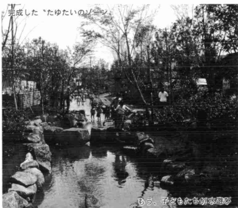
小松川境川親水公園

問合せ=環境促進事業団 ☎2693 交通= 菅原橋・森林公園・文化センター・ 江戸川区役所・京葉交差点はか