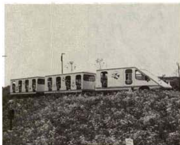
▲パノラマシャトルは夢を乗せて走ります。