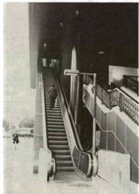
▲エスカレーターで改札口へ

東側からエスカレーターで、上りホームに直結。混雑緩和の決め手として、8月3日(火)にオープンします。