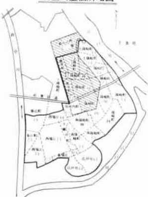
調査測量箇所略図

子どもの家、砂場、2連シーソー恐竜、2方スベリ台、幼児用ジャンダルジム、幼児用4連ブランコ、タイルカラーがあります。 了すると、総幅員15メートル、グリーンベルトと歩道のある立派な道路ができあがります。 しばらくの間ご不便をおかけしますが、みなさんのご協力をお願いします。