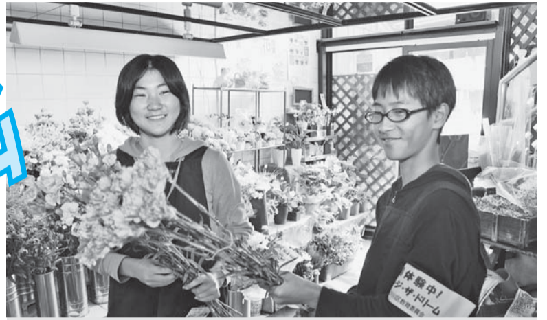
▲生花店で笑顔で仕事に取り組む中学生

区立中学校の2年生全員が5日間の職場体験を行う「チャレンジ・ザ・ドリーム」は、今年で7年目を迎えました。地域みなさんにご協力いただき、中学生が一生懸命、仕事に取り組んでいます。今年度もご支援、ご協力をお願いします。 ☎ 指導室 ☎(5662)1634