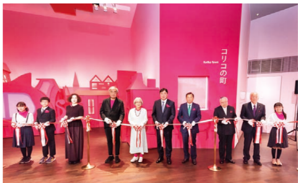
10月17日には「魔法の文学館」のオープニングセレモニーが行われました