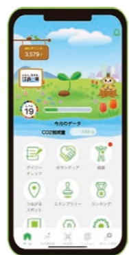
SDGsアプリ「eito」のトップ画面

また本区では共生社会の実現を目指し、令和3年7月に「ともに生きるまちを指す条例」を制定しましたが、それに関連する条例として本定例会には「多文化共生のまち推進条例」をお諮りしています。