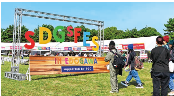
区では9月25日～12月9日までを「SDGs Season」として、SDGs FESの開催などさまざまな取り組みを実施しました

特に給食費については、今年9月、区立小・中学校や幼稚園、認定こども園で無償化し、10月には保育ママでも無償で