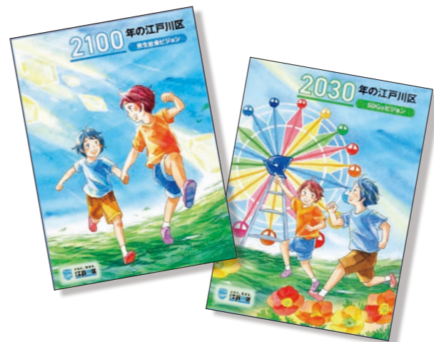
未来に向けた二つのビジョンを基に今年度は実現に向けた「アクションプラン」を策定

コロナ禍を経て景気は回復基調にあり、現在のところ区の税収も堅調に推移しています。しかし、物価や人件費の高騰など急速に変化する社会情勢への対応をはじめ、いつ発生してもおかしくない大規模災害への備えや、公共施設の再編・整備など、