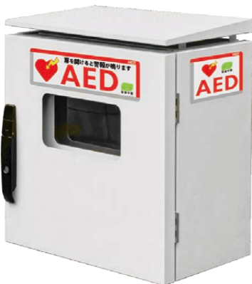
屋外に設置するAED（イメージ）

そこで、今年度は区立施設128カ所、来年度は100カ所以上のAEDを屋外へ移設します。これにより全ての区立小・中学校をはじめ、設置可能な施設において屋外化が進み、機器の利用環境が整います。大切な命が助かる可能性を1%でも高められるよう、集中的に取り組んでまいります。