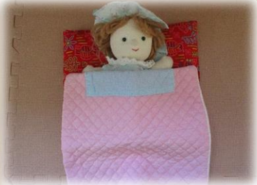
人形用のお布団 赤ちゃんはお布団に寝かせます