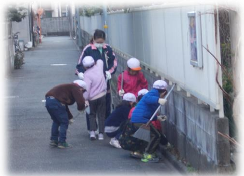
近隣の清掃活動に参加