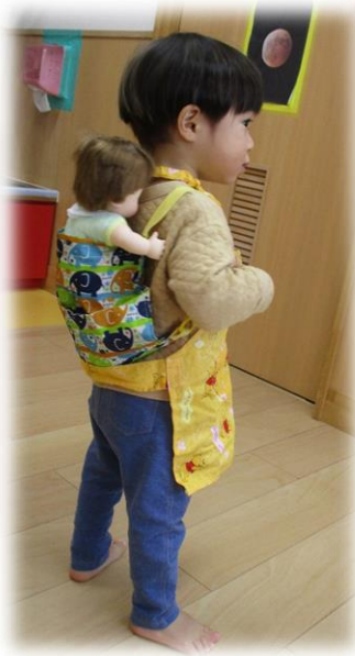
前でマジックテープで留められるおんぶ紐