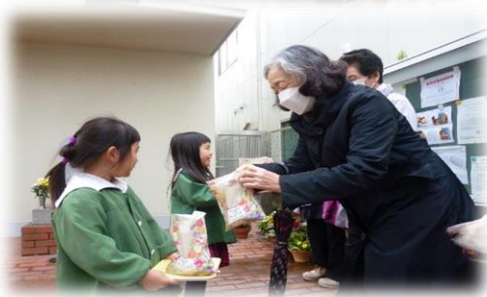
地域の方に手作りおやつをプレゼント