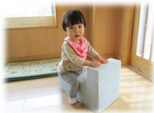
牛乳パックで作った乗り物