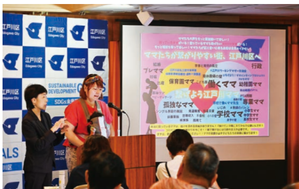
8月23日・24日に行われた「区民と区職員による政策提案プレゼンテーション」では、参加者からさまざまな提案を頂きました。

本定例会にはこれら補正予算に加え、「ともに生きるまちを目指す条例」に関連する四つの条例の新設など、合計で21件の議案をお諮りしています。さらに、決算の認定など5件の報告事項もごさいます。それぞれご審議の上、ご決定いただきたいと存じます。