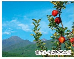
市内から望む常念岳

豊かな景観を求めて観光客が訪れる安曇野市。その魅力は手付かずの自然だけでなく、生活と調和した農のある風景をはじめとする「安曇野らしい暮らしぶり」にも見ることができます。