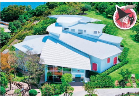
なぎさ公園内に開館する魔法の文学館（南葛西7-3-1）

アクションプラン策定の過程では、2度にわたって意見募集を行い、多くの方からご意見をいただきましたが、その中で区内40代の方から次のようなコメントもいただきました。