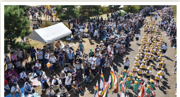
▲沿道からの声援の中を進む場内パレード(平成30年の第41回)