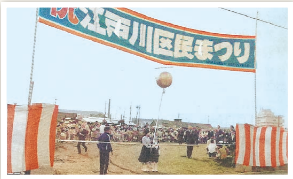
▲小松川地区で行われた第1回でのパレード出発式(昭和53年10月1日)。区のモノクロ資料を、井桁さんの記憶を基に着色しました

ハッピー…当時から本当に「手作り」のおまつりだったんだね。今年の場外・場内の二つのパレードにも大勢の人の思いが詰まっているから、皆さんに見て楽しんでほしいよね。 井桁さん…ハッピーちゃんもパレードの主役の一人だからね、よろしく頼むよ! ハッピー…お任せください! 今から張り切ってるもん。さあ井桁さん、「広報えどがわ」を読んでいるみんなに声を掛けようよ。せうの… 井桁さん／ハッピー…10月8日だよ! 区民まつりに全員集合〜!!