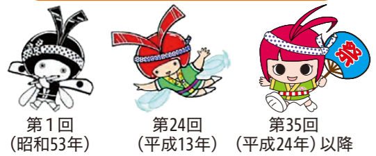
第1回 (昭和53年) 第24回 (平成13年) 第35回 (平成24年)以降

当初はイラストだけだったハッピーちゃんが実際にパレードに登場してくれた時はうれしかったなあ。しかしこうして見てみるとハッピーちゃん、ずいぶん印象が変わったね!