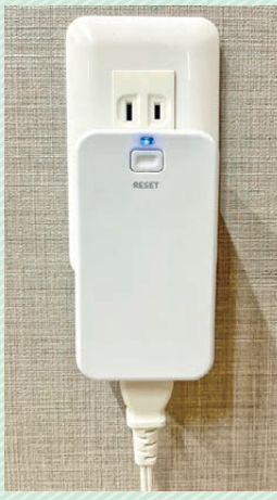
▲感震ブレーカー(コンセント型) 使用イメージ

地震に伴う火災の原因は、半数以上が電気によるものです。強い揺れを感知したときに、接続された機器の電源を自動停止する「感震ブレーカー」は、電気による火災を防ぐ効果があります。