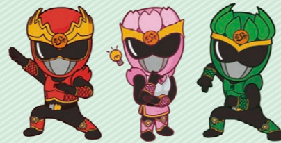
▲商売繁盛エドレンジャー