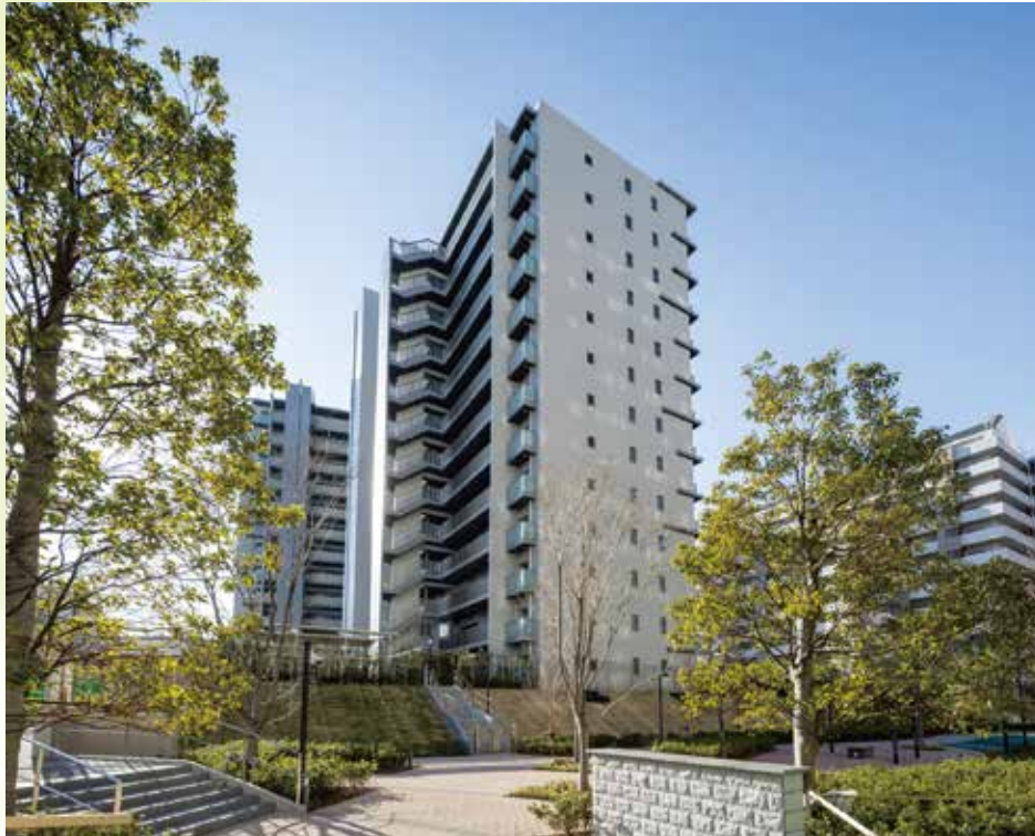
▲第12回建築部門受賞「オーベルグランディオ平井」(分譲共同住宅/小松川三丁目)