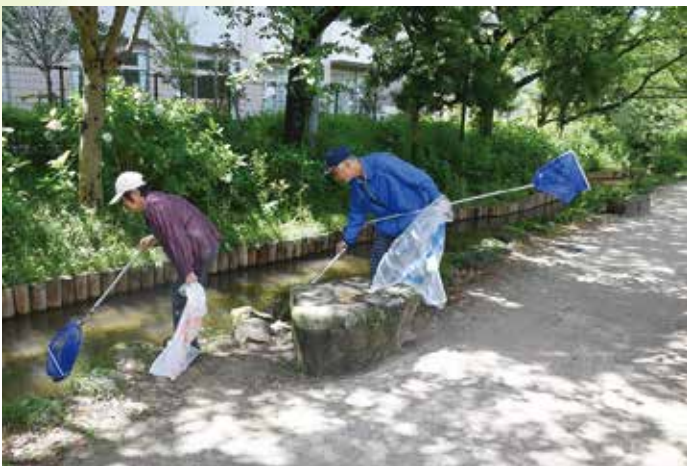
▲第12回活動部門受賞「篠田堀親水緑道を愛する会」