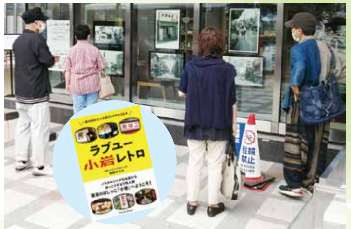
▲第12回活動部門受賞「小岩コンテンツプロジェクト」