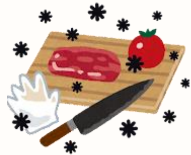
器具を使い分けていない