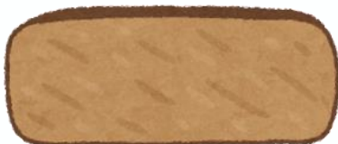
中心部まで火が通っている