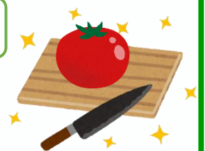
器具を使い分けている