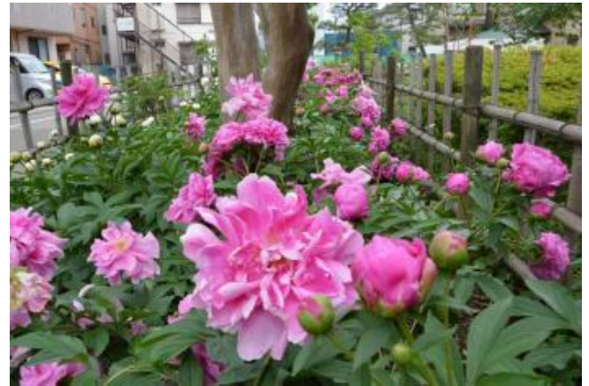
シャクヤクの花

「目には青葉 山時鳥 初松魚」。公園の木々の生き生きとした緑と、芍薬の紅色が目を楽しませてくれます。区内には、初ガツオをメニューに入れている料理店があります（ホトトギスは区内にはいないようですが、奥多摩の方に行くとなき声が聞けそうです）。二十四節気「小満」は太陽の光を浴びてすくすく成長する生命に満ち始める時季のことで、今年は5月20日です。