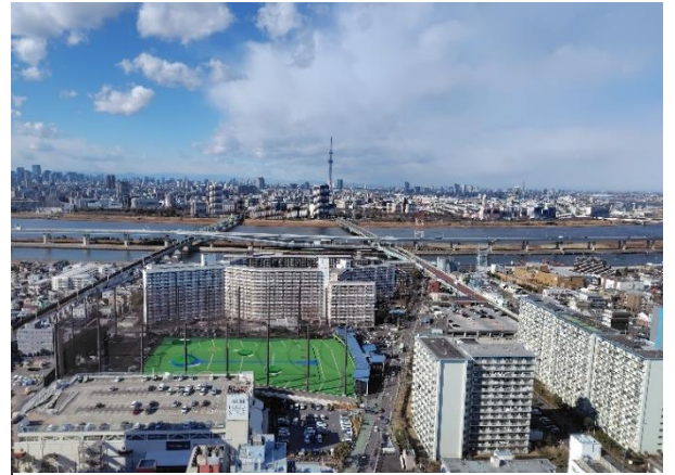
写真 タワーホール船堀のタワー展望室から見たスカイツリー方向の眺め

まずは気温です。年間の平均気温は、江戸川臨海のアメダスによると15.9℃です。これは、東京都心の15.8℃よりも0.1℃高いです。僅かに高いのですが、冬の気温が都心よりも暖かいことが関係しています。年間の冬日（最低気温が氷点下）の日数を比べると、都心は15.2日、江戸川臨海は6.3日なので、都心より冷え込みが少し弱