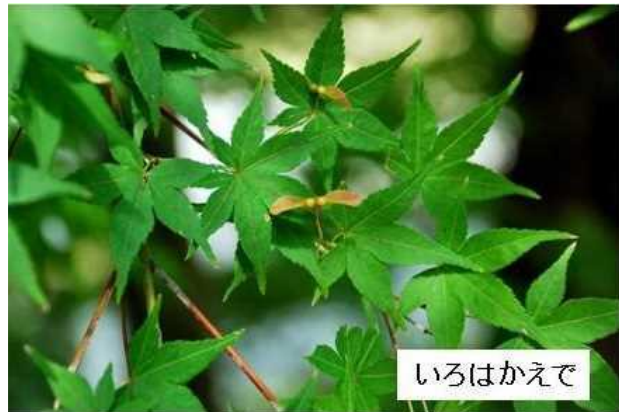
写真 紅葉前の「いろはかえで」

さて、かえで紅葉日は9月の気温と関係があることをお伝えしましたが、近年、温暖化の影響で9月の気温が高く、紅葉日も遅れています。東京の昨年の紅葉日は11月29日と平年並みでしたが、宇都宮では12月5日（15日遅い）、秋田では11月28日（16日遅い）など東北や関東北部で平年よりかなり遅くなりました。そこで、もっと昔の紅葉日はどう