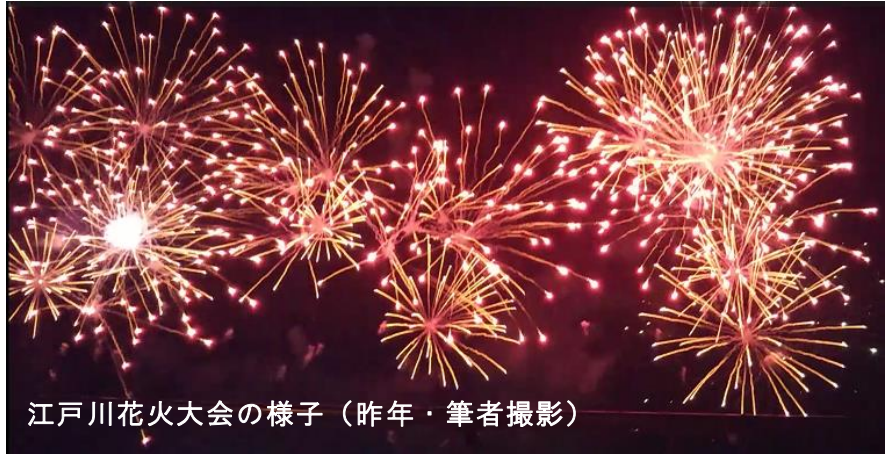
江戸川花火大会の様子（昨年）

さて、花火大会の天気はどうなるのか気になるところです。先月は雷雨の影響で足立区の