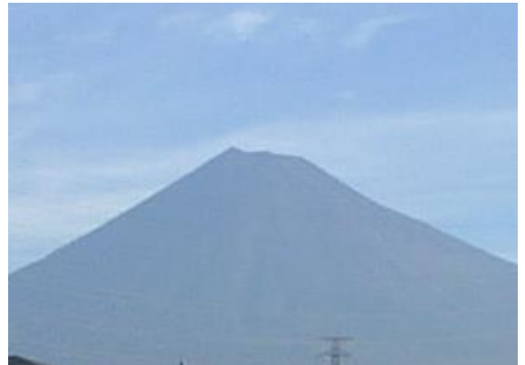
夏の富士山

さて、山では江戸川区とどのくらい気温差があるのでしょうか。富士山を例に考えてみます。