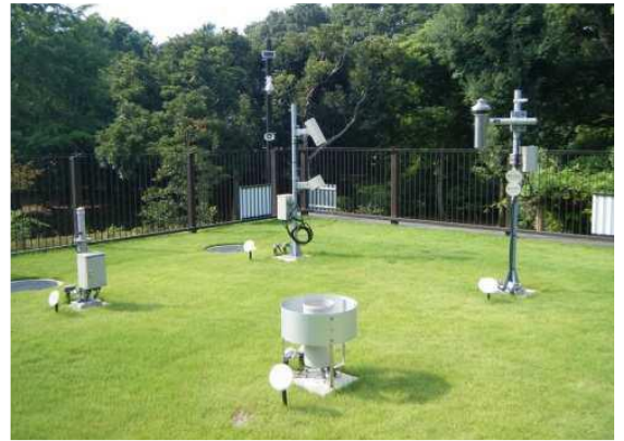
北の丸露場の様子(気象庁HPより)

7月22日は「大暑」、一年で最も暑い頃とされています。東京消防庁によると、熱中症搬送者数が昨年最も多かったのは7月だそうです。昨年は6月が674人だったのに、7月は3,502人と急が増えています。梅雨が明けると暑さ指数もぐっと高くなります。一方、体がまだ暑さに慣れていないため、熱中症になりやすいようです。体が暑さに慣れる（暑熱順化）のために、歩く・軽く走るなど適度な運動をしたり、お風呂で湯船に浸かったりして無理のない範囲で汗をかき、熱中症から身を守りましょう。