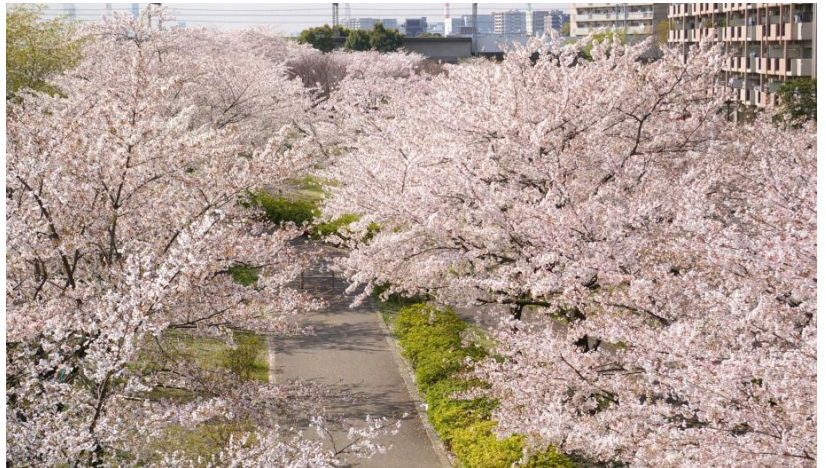
小松川千本桜

暖かくなり一気に咲き始めた桜がいよいよ満開。新たな希望を胸に新年度を迎えた方も多いでしょう。うららかな日差しを受けて全てのものが明るく清らかになるというこの時季は二十四節気のうちの「清明」とよばれています。日本の四季は春夏秋冬4つに分けられますが、二十四節気は1つの季節をさらに6等分して決められた暦で、清明は毎年4月4日～5日頃となります。