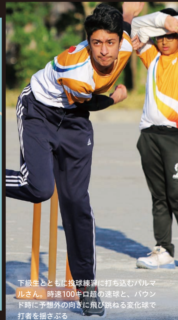
下級生とともに投球練習に打ち込むバルマルさん。時速100キロ超の速球と、バウンド時に予想外の向きに飛び跳ねる変化球で打者を揺さぶる