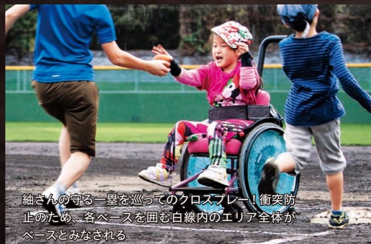
紬さんの守る一塁を巡ってのクロスプレー！ 衝突防止のため、各ベースを囲む白線内のエリア全体がベースとみなされる

きました。「お恥ずかしい話ですが、5年たったのにまだに正式なルールブックを公表できていません。いろいろな方に体験してもらった際に新たな条項を足していくものだから、なかなか確定版にたどり着けなくて…」 しかし、あまたのルール改正は、快く汗を流す機会を求めて球場を訪れた人を、誰一人取り残さないための創意工夫が絶えず続いている証し。「歓迎」を花言葉とする、藤色の柔らかな花「デュランタ」から名付けられたこの球技は、共生社会の実現に向けた江戸川区のチャレンジを象徴しているといえるかもしれません。