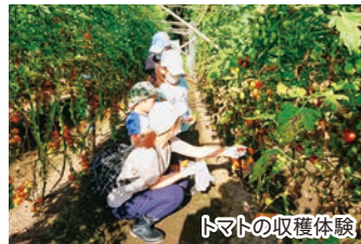
トマトの収穫体験

塩沢江戸川荘の夏は、野菜の収穫体験や星空観察、昆虫採集など楽しいイベントがめじろ押し! また、周辺には川遊びや山でアスレチックなどが楽しめる、家族で訪れたい自然スポットが満載です。ぜひお越しください!