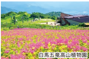
白馬五竜高山植物園