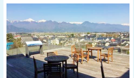
くつろぎコーナー（障子時も一般開放）