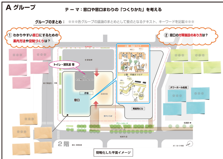
ワークショップで使用した配置イメージ図