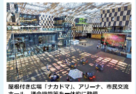
歴史付き広場「ナカドマ」、アリーナ、市民交流ホール、議会機能等を一体的に整備