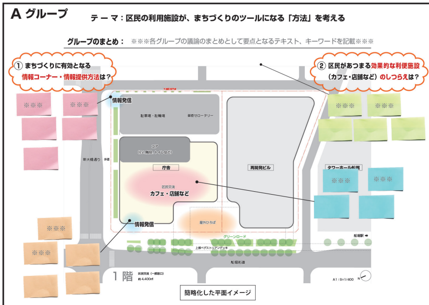
ワークショップで使用した配置イメージ図