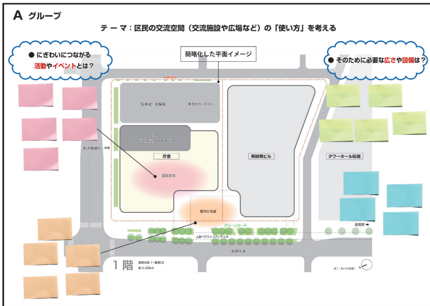
ワークショップで使用した配置イメージ図