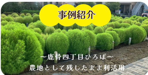
～鹿骨四丁目ひろば～