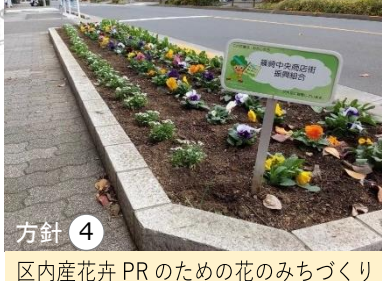
方針④ 区内産花卉PRのための花のみちづくり