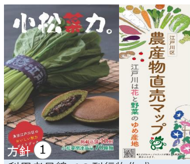
方針① 利用者目線での刊行物作成