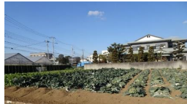
方針② 生産緑地の指定による農地の保全