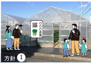
方針① 看板の活用など多彩な情報発信