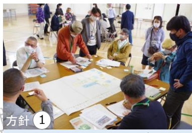
方針① 農の風景育成ワークショップの実施

この地図は、東京都縮尺 2,500 分の 1 地形図を利用して作成したものである。(承認番号) MMT 利許第 04-123 号