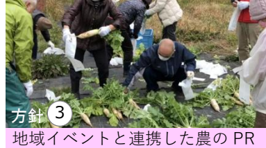
方針③ 地域イベントと連携した農のPR