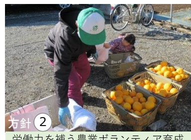
方針② 労働力を補う農業ボランティア育成