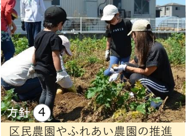
方針④ 区民農園やふれあい農園の推進