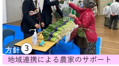
方針③ 地域連携による農家のサポート