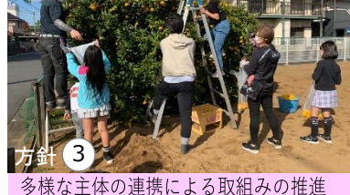
方針③ 多様な主体の連携による取組みの推進