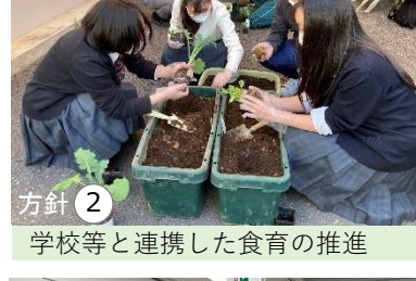
方針② 学校等と連携した食育の推進