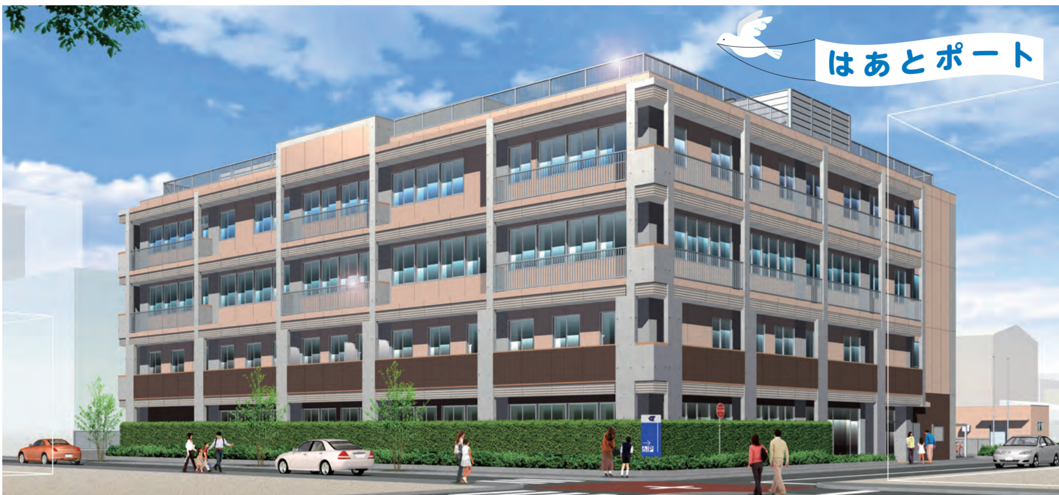
▲はあとポートの外観 街並みに溶け込む温かみのある色調で、誰もが気軽に立ち寄れる施設を目指します。