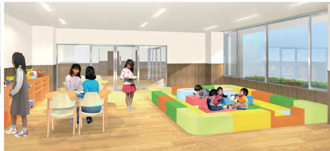
◀1階の地域交流スペース。子育てで交流会や里親サロンなどが定期的で開催され、交流の場として利用できます。