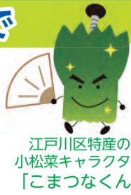
江戸川区特産の小松菜キャラクター「こまつなくん」