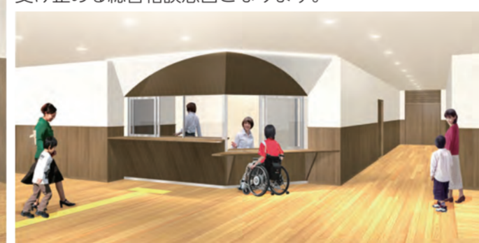
▼3階受付。子どもに関するさまざまな相談を1カ所で受け止める総合相談窓口となります。

平成22年に区内で発生した児童虐待による死亡事故。このような痛ましい事故が二度と起きないよう、「江戸川区の子どもは江戸川区で守る」ことを理念に、一貫した指揮系統の下で虐待対応を行えるよう、区が所管の児童相談所の設置に向けて整備を進めてきました。