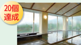
ペア宿泊券 (穂高荘)