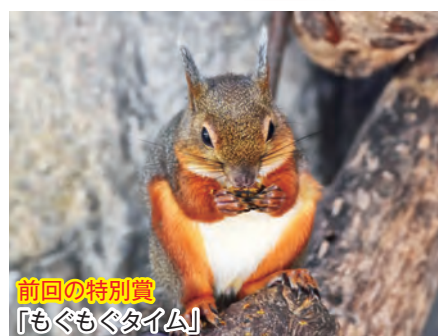
前回の特別賞 「もぐもぐタイム」