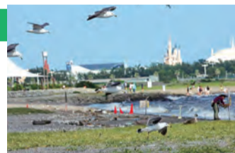
▲パネル展示の一例(葛西海浜公園西なぎさ)