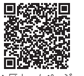
▲区ホームページ指定歯科医療機関一覧

問 後期高齢者医療制度に加入の方⇒保健事業係 ☎5662-0623 / そのほかの方⇒介護保険課事業者調整係 ☎5662-0032