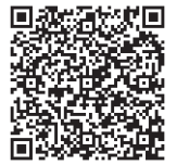
▲区ホームページ指定歯科医療機関一覧