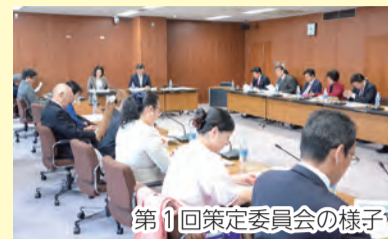
第1回策定委員会の様子