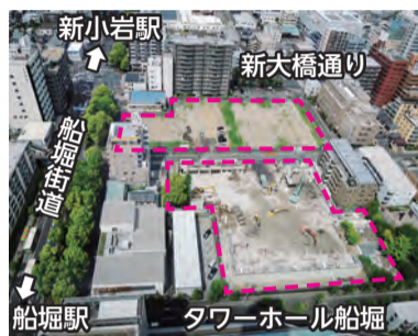
▲建設候補地の概況 (点線枠内：船堀四丁目都有地)