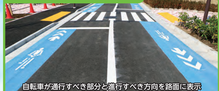
自転車が通行すべき部分と進行すべき方向を路面に表示