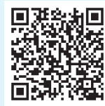
▲区ホームページ助成金情報QRコード

凡例 日 日時(日程) 時 時間 場 場所 内 内容 人 定員(対象) 料 費用 師 講師(敬称略) 出 出演(敬称略) 持 持ち物 主 主催 共 共催 後 後援 協 協力 申 申し込み 問 問い合わせ 電 電子メール 画 ホームページ