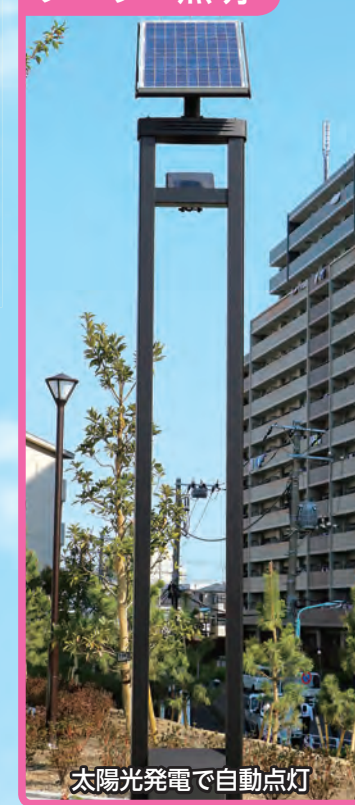
太陽光発電で自動点灯