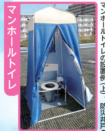
マンホールトイレの設置例(上)、防災井戸の井戸水(下)を利用して水を流します