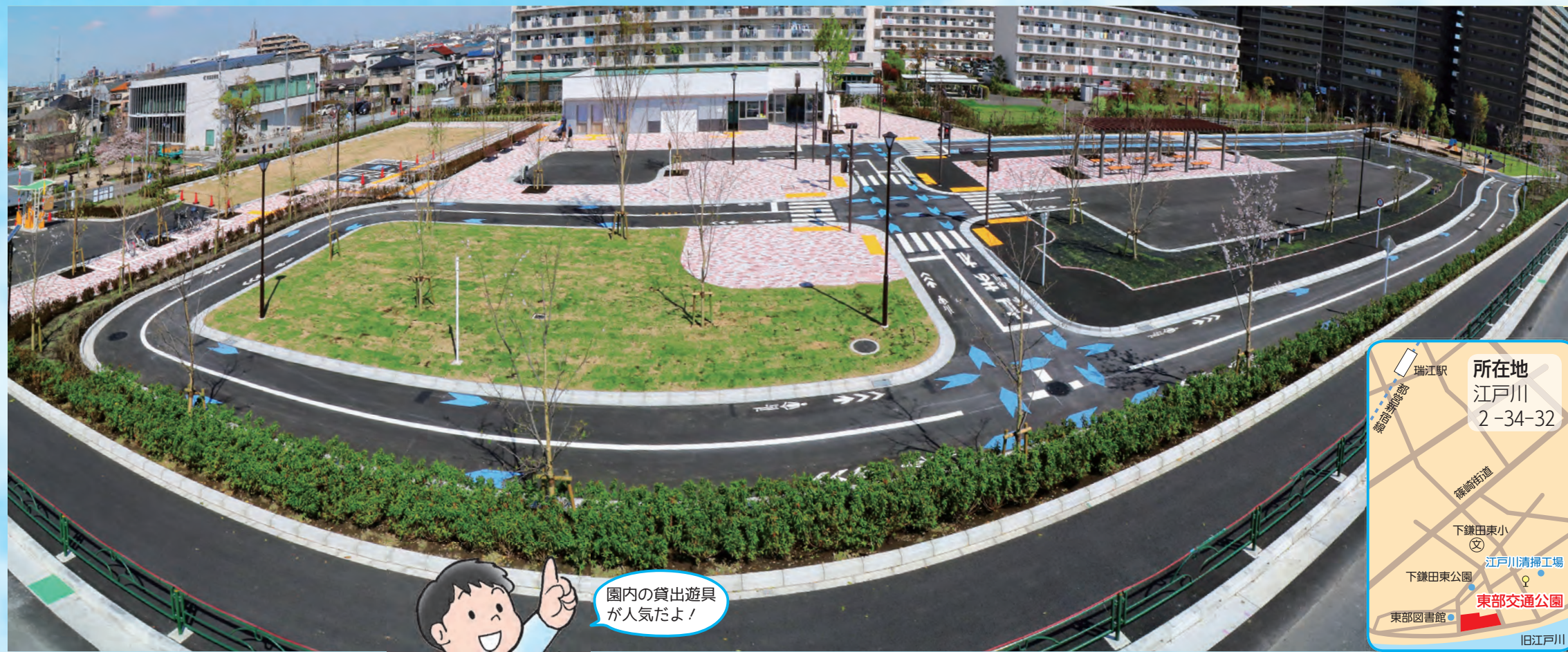
園内の貸出遊具が人気だよ!