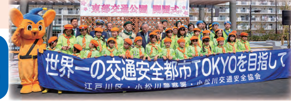
世界一の交通安全都市TOKYOを目指して 江戸川区・小松川警察署・小松川交通安全協会