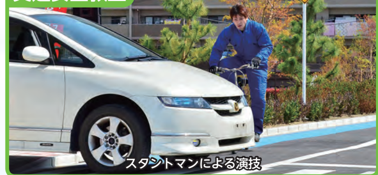
スタントマンによる演技