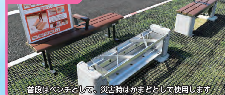
普段はベンチとして、災害時はかまどとして使用します