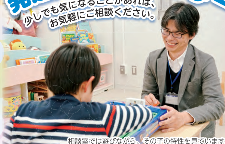
相談室では遊びながら、その子の特性を見ています。