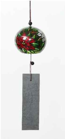
デザイン：女子美術大学 戸高 麻椰