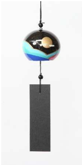
デザイン：女子美術大学 田野 ゆかり