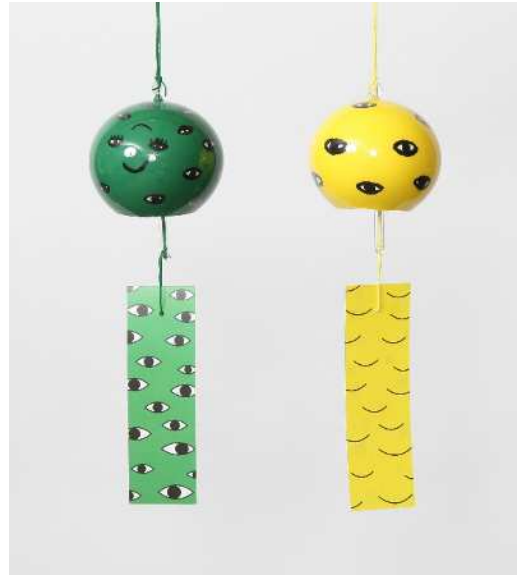
デザイン：女子美術大学 陳 妍如