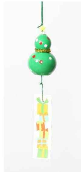
デザイン：女子美術大学 紙野 ゆう