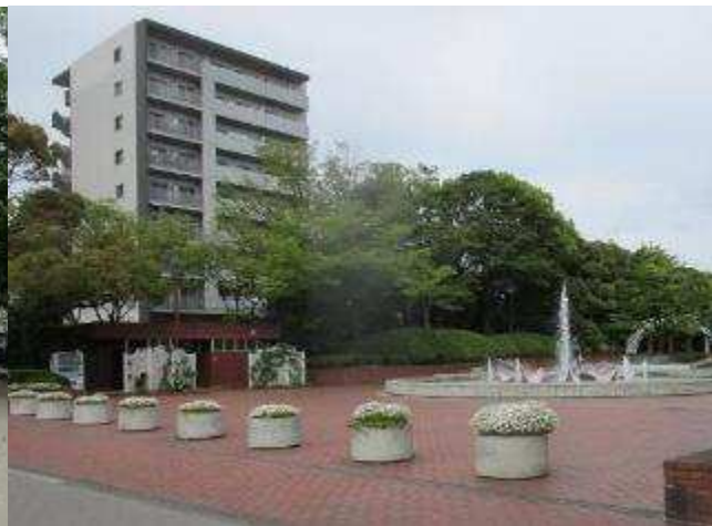
フラワーガーデン