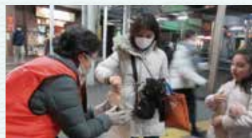
お子様・若者・熟年者 多くの方が募金してくれました