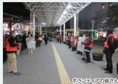
ボランティアの皆さん