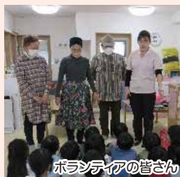
ボランティアの皆さん

けん玉、ケンケン飛び、あや取り、毬つき、羽根つきなどを教えながら、昔の遊びを楽しみました。毬つきや羽根つきをやったことのない園児がほとんどで、みんな笑いながらはしゃいでいました。