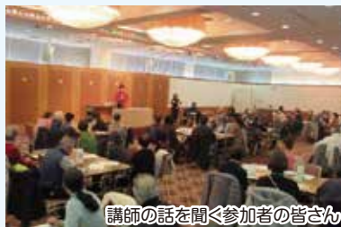
講師の話聞く参加者の皆さん