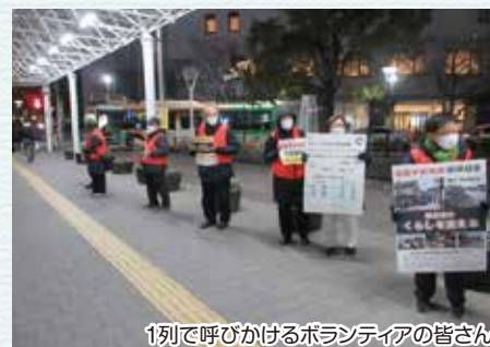
1列で呼びかけるボランティアの皆さん

能登の被災地の一日も早い復興を願うとともに、この街頭募金活動に協力いただきましたボランティアの皆様、そして、その呼びかけに応じてくださいました多くの区民の方にお礼申し上げます。ありがとうございました。