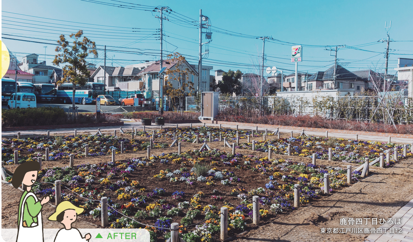
鹿骨四丁目ひろば 東京都江戸川区鹿骨四丁目12