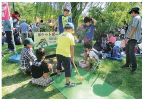
▲区民まつりでも活躍

中学生と高校生を対象に、子ども会や地域のリーダーを育成しています。セミナー修了後は、ジュニアリーダー講習会や地域のイベントなどで、お兄さんお姉さん役として活躍しています。