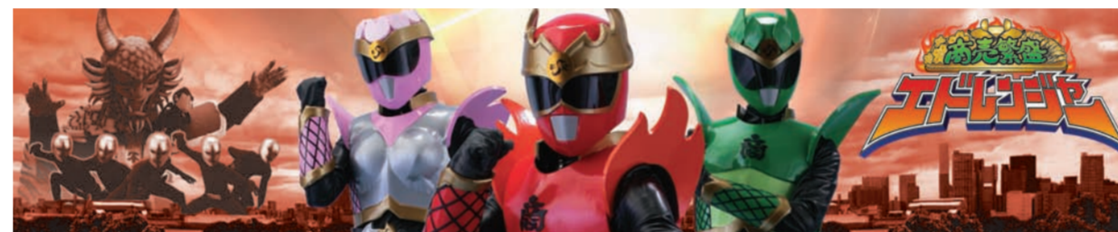
2月8日・9日 葛西臨海公園「水仙まつり」に参上!